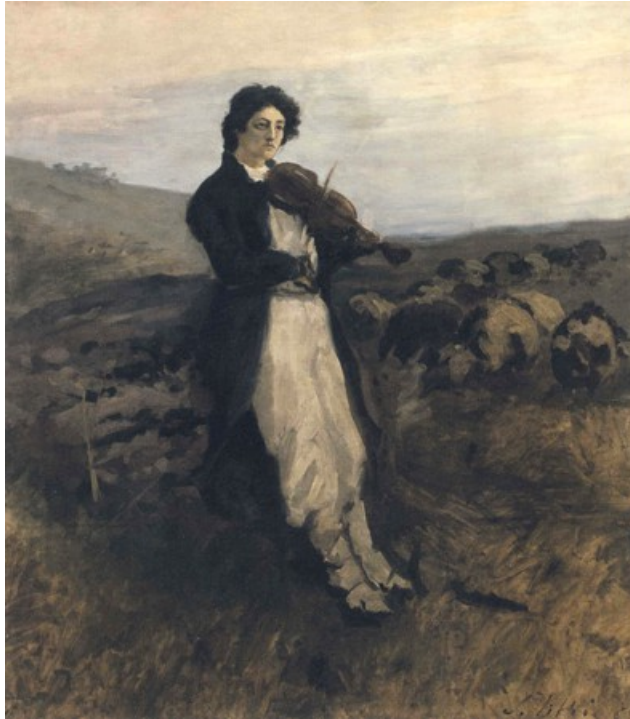
Stanisław Witkiewicz, Grajek, olej/plótno, ok. 1877 Muzeum Narodowe Warszawa

Patrz! moje serce było jak grób ciemny I połamane mojej myśli skrzydła – Rozpacz zawiodła duszę w świat podziemny Śmierci – a wyobraźnię obsiadły straszycła Przed okiem których bledną ludzkie twarze – Ach! ja tam byłem skąd nie wrócił żywy Nikt – gdzie stoją śmierci żalobne ołtarze; I ślub z nicością zawrzeć chciałem niemy – Ja tylko trupem mogłem być szczęśliwy – Lecz nad tym martwym teraz dla mnie światem Twa dusza blask swój rozlała słoneczny I czarny całun przysypała kwiatem. Więc dzięki tobie, duchu czarnooki, Znów mi się skrzydła prostują do lotu, Znów hardo patrzę na czarne obłoki I znowu żyć chcę wśród burzy i grzmotu – Lecz twoje życie to jak komet droga W nieskończoności zakreślona kole, Przyszłaś na chwilę, jak wystanka Boga, Z geniuszu gwiazdą świecącą na czole I znów odchodzisz! Czy kiedy wrócisz? Nigdy, nigdy może! Więc to ostatnie na mym niebie zorze? Jeśli nim wrócisz, ja pójdę do trumny, Niech mi zostawią otwarte powieki A w martwe ręce nie obrazek święty, Lecz niech mi dadzą obraz Twojej twarzy – Szlanna źrenica ma niechaj przez wieki