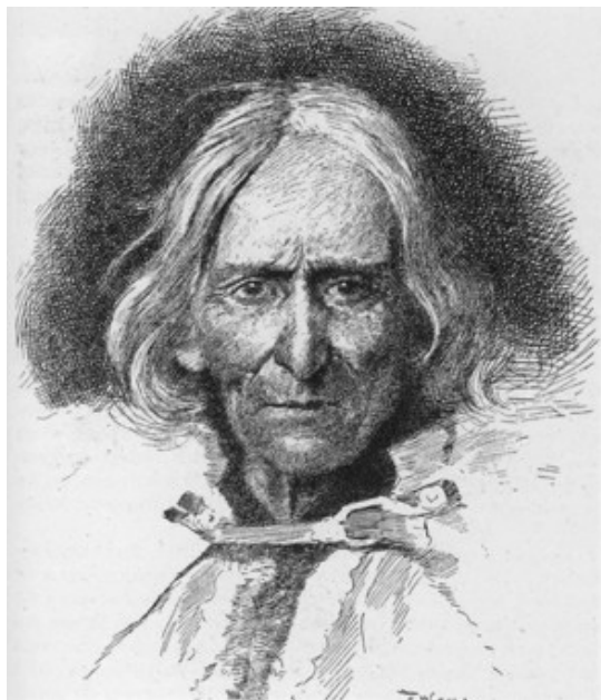
Sabała według rysunku Witkiewicza („Wisła” 1892, z.1)